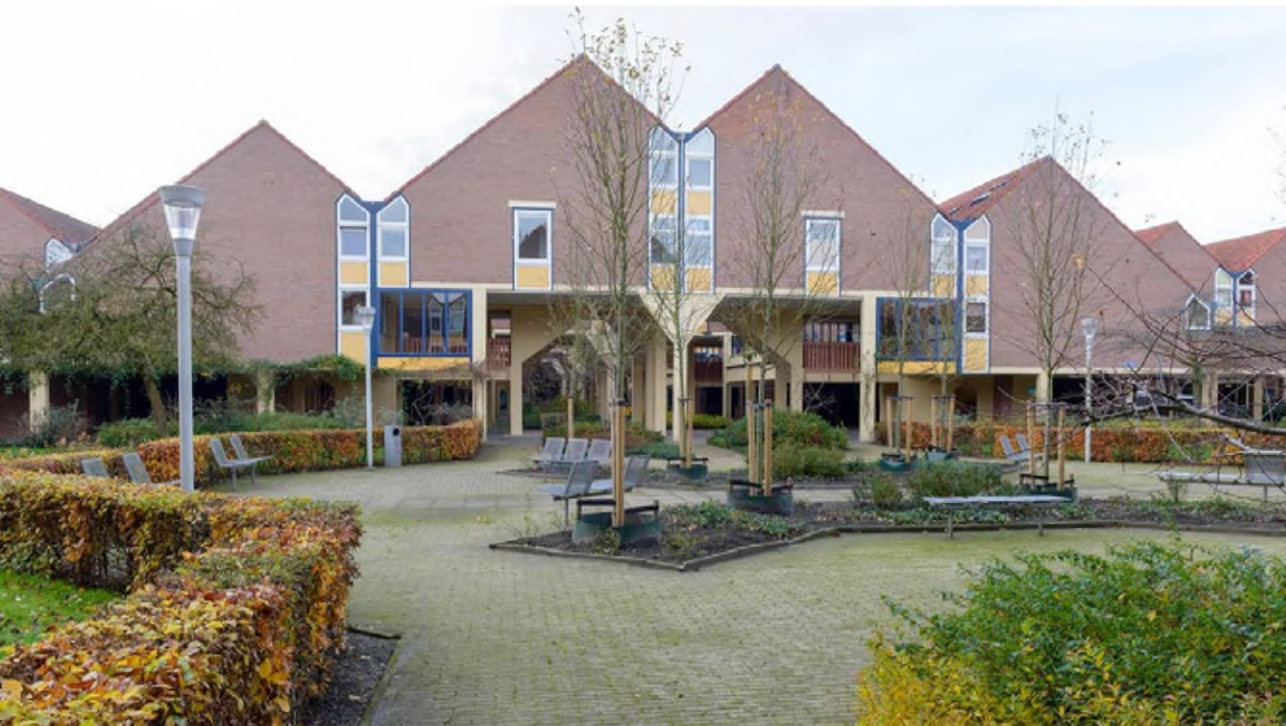
Wooncomplex De Kasbah in Hengelo dat is voorgedragen als een Post 65-rijksmonument.