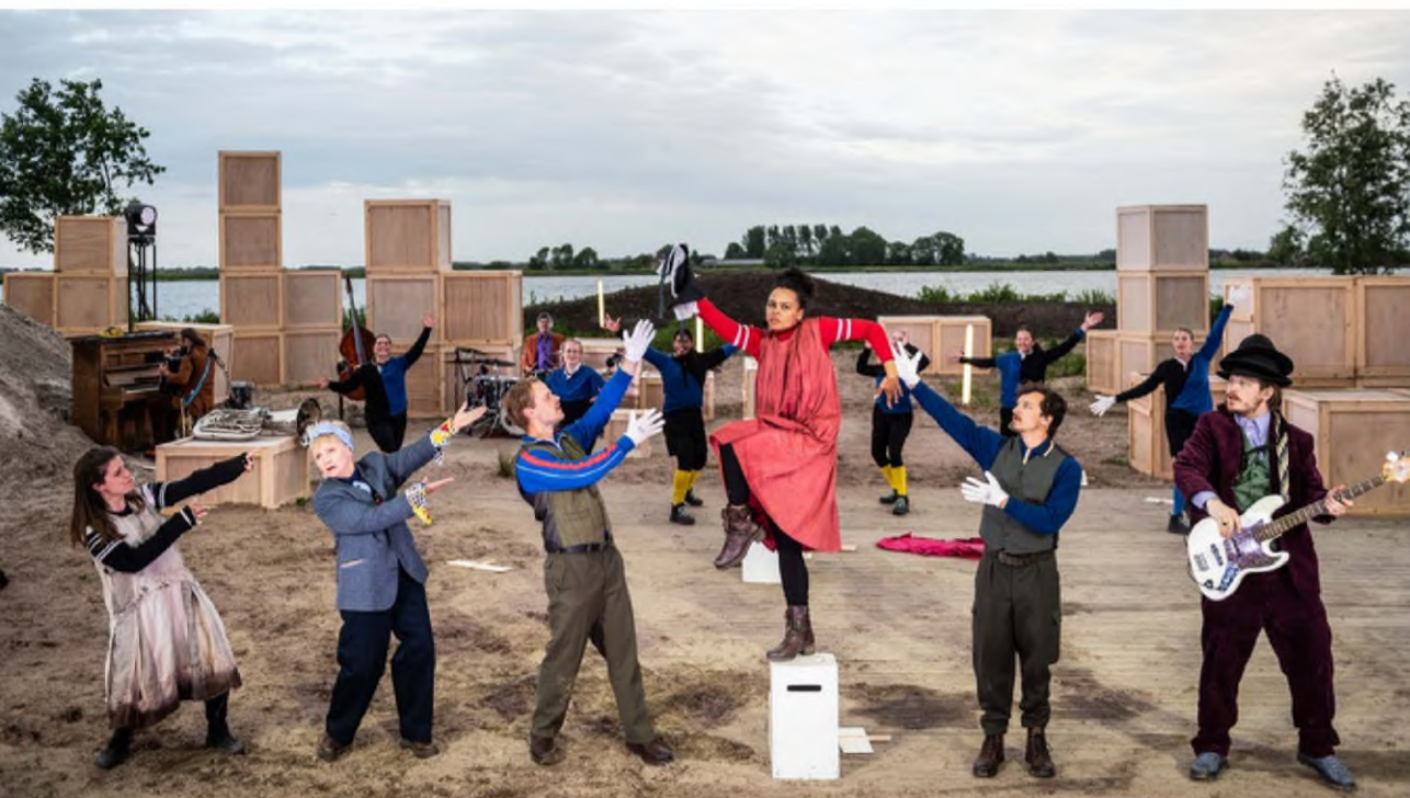
De Raad voor Cultuur is aanwezig bij de openlucht muziektheatervoorstelling De revolutie van de Rinsema's . Het stuk speelt zich af tegen het decor van de zandafgraving in Nij Beets (Fryslân).