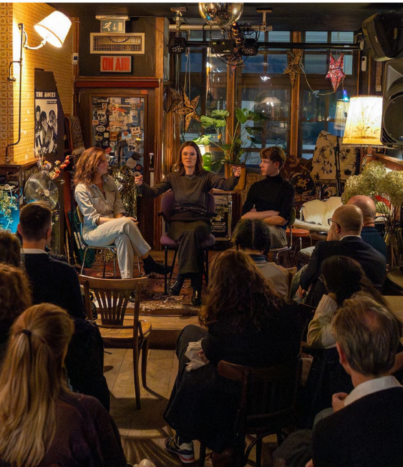
De Raad voor Cultuur praat met makers over talentontwikkeling in Zeeland.