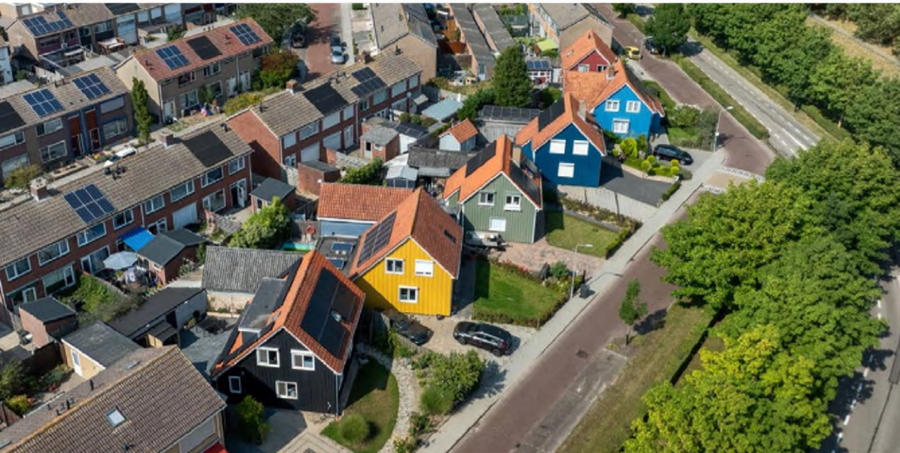
Houten prefab-woningen die kort na de Watersnoodramp door onder meer Noorwegen, Zweden, Finland en Oostenrijk zijn geschonken aan Nederland.