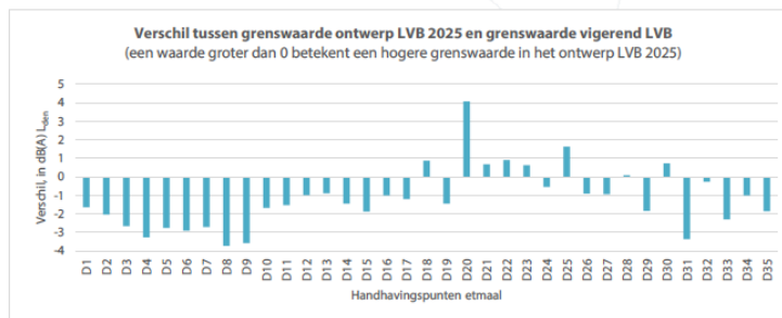
Figuur 5 Verskil in grenswaarden voor de etmaalperiode tussen vigerend LVB en ontwerp LVB 2025, op basis van Doc29 en bepaald in de vigerende LVB-handhavingspunten.