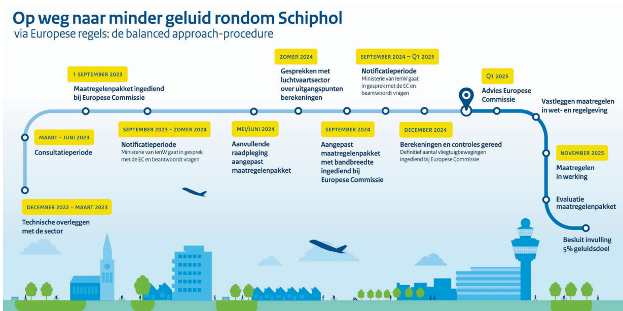
Figuur 1 – Balanced approach-procedure als basis voor het milieueffectrapport. Met het maatregelenpakket uit deze procedure wil de minister de geluidshinder rondom Schiphol met 15% laten afnemen. Bron: overheid.nl . 7

Om de geluidshinder terug te dringen, heeft de minister eerder een zogeheten 'balanced approach'-procedure 6 doorlopen (zie figuur 1 hieronder). Het maatregelenpakket hieruit is de basis voor het MER.